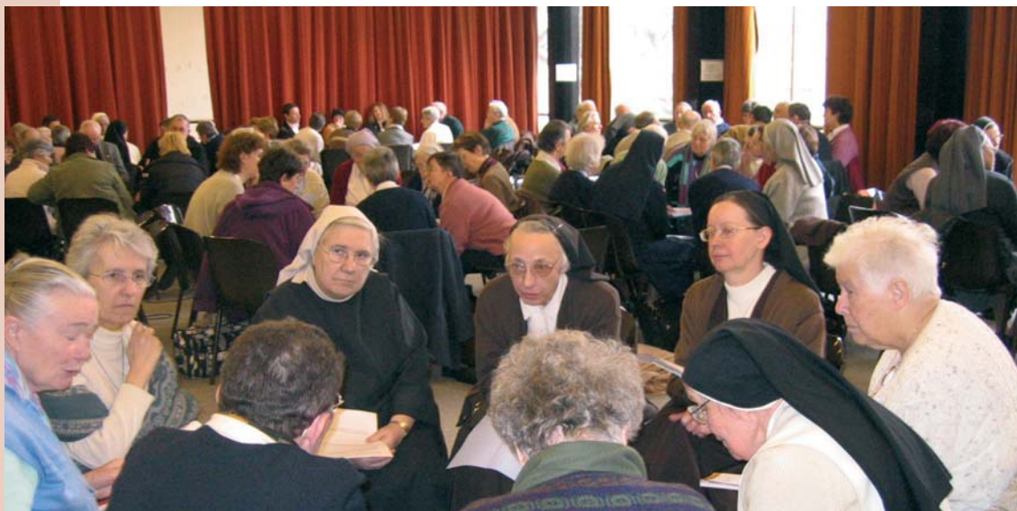
Réunion des Secrétaires de Sections à Paris le 22 mars 2006 / Carrefours

> Nouvelle maison : Maison d'accueil "Île Blanche" B.P. 13 29241 LOCQUIREC CEDEX Tél : 02 98 67 43 72