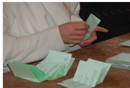
Dépouillement des votes

► Gamme laïcs individuel : Evolution du niveau des prestations (hospitalisation, consultations, dentaire et optique). Evolution des cotisations de 7,2 %*.