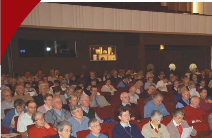
Les Délégués attentifs